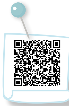
Geldanlage – Festgeldkonto und Kombisparen