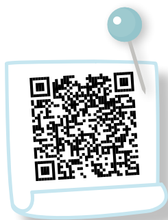
Geldanlage - Basismodul

ZIELGRUPPE 11./12. Schulstufe HAK, HWLA, AHS