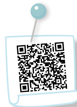
Geldanlage – Basics Kryptowährungen

Du kennst dich bereits aus? Dann ist es nun an der Zeit, dein Wissen anhand der folgenden Aufgaben zu überprüfen. Was hast du dir gemerkt? Wo musst du vielleicht nochmal nachlesen? Viel Spaß beim Rätseln!