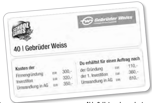
Abb. 3: Unternehmenskarte

Jedes Mal, wenn du das Startfeld passierst, zahlt dir die Bank eine Förderung von EUR 400,- aus. Solltest du direkt auf dem Startfeld landen, erhältst du sogar eine Förderung in der Höhe von EUR 800,-.