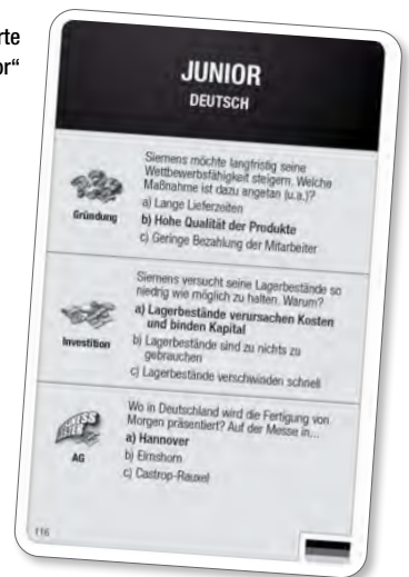
Abb. 2: Fragekarte „Junior“

Kommst du auf ein Unternehmen, das noch niemand besitzt, hebt die Person zu deiner Linken die oberste Fragekarte vom Kartenstapel ab und stellt dir beim BUSINESSMASTER die „Gründungsfrage“ und beim MINTMASTER eine beliebige Frage der Karte. Bei richtiger Antwort erhältst du die Unternehmenskarte des Unternehmens von der Bank und bezahlst an diese die auf der Karte angeführten Gründungskosten.